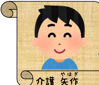
介護 やはぎ 矢作